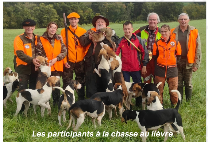
Les participants à la chasse au lièvre