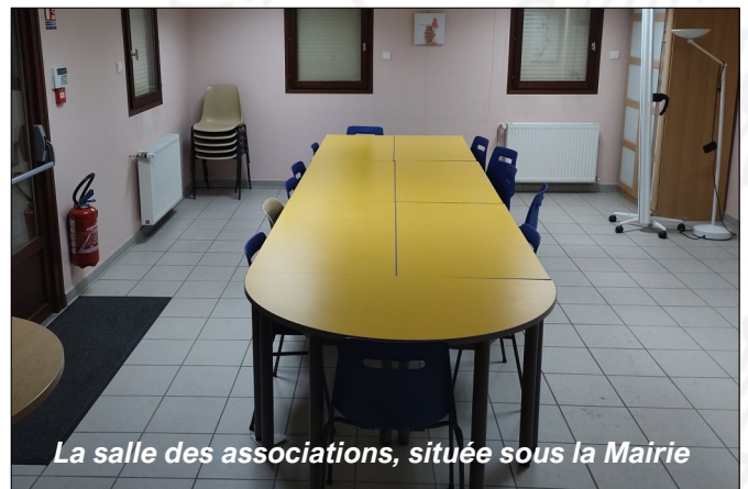
La salle des associations, située sous la Mairie

Quant aux associations qui utilisaient la salle, elles seront momentanément orientées vers la salle communale, dans l'attente de la livraison de la nouvelle salle des associations, située dans le futur bâtiment communal derrière l'école.