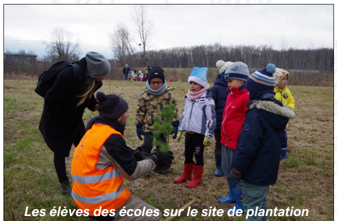
Les élèves des écoles sur le site de plantation

Le dernier café débat de l'année, qui avait pour thème « composez vos produits naturels », a réuni une vingtaine de personnes autour de notre animatrice Floriane CHARRIER. Les participants ont appris comment confectionner des produits d'entretien à partir de matières végétales ou minérales naturelles.