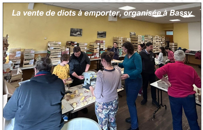
La vente de diots à emporter, organisée à Bassy