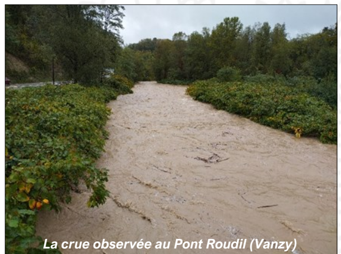
La crue observée au Pont Roudil (Vanzy)

Le 9 octobre à 14h, le débit était redescendu à 12 m 3 /s, marquant la fin de cet épisode de crue.